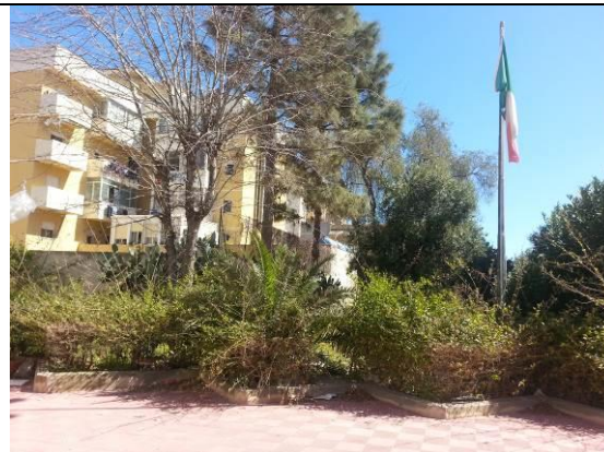
Particolare delle essenze vegetali ad alto fusto