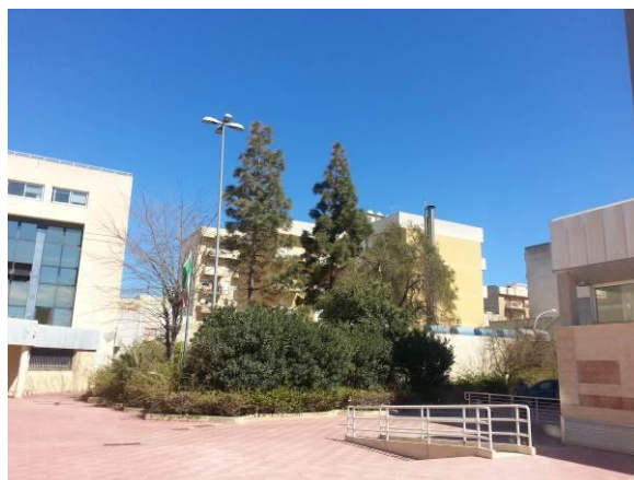
Area esterna a verde