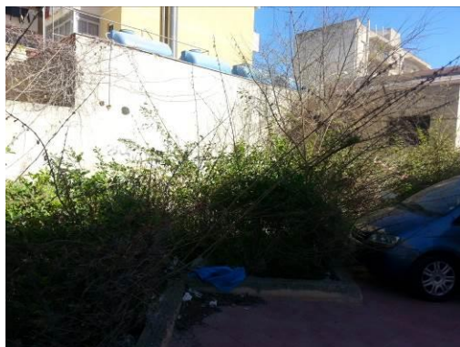
Particolare delle siepi presenti