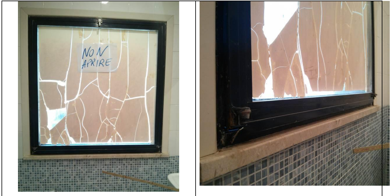
infisso esterno in alluminio elettro colorato blu ubicato al piano terzo – serv. igien. donne