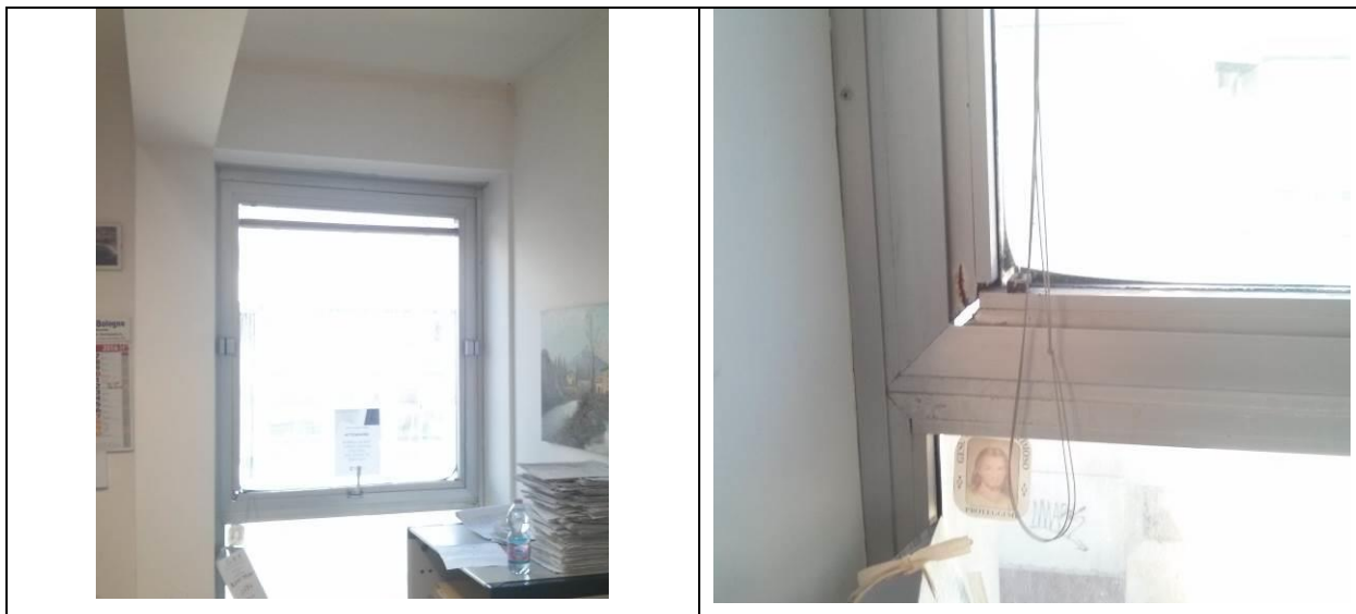
infisso esterno in alluminio anodizzato "Silver" ubicato al piano secondo - stanza 1

Si riportano di seguito alcune fotografie relative agli infissi oggetto della prestazione