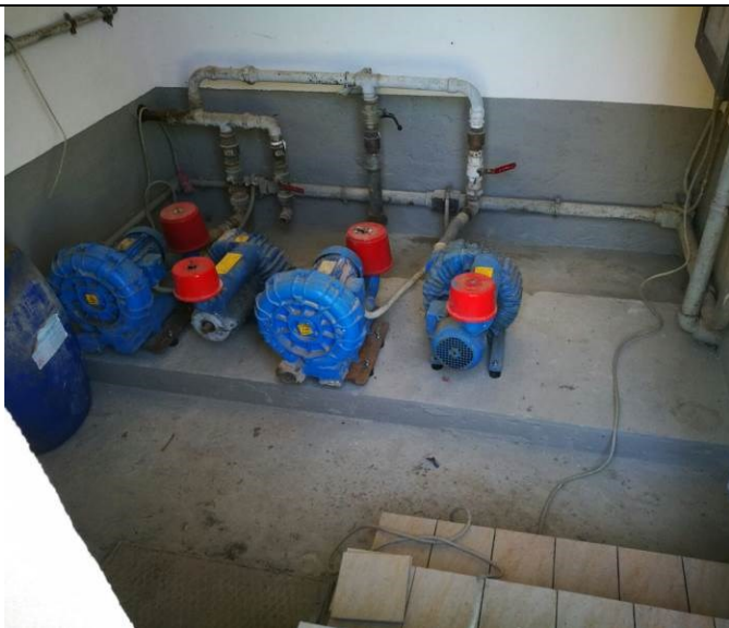
Soffianti a canali laterali