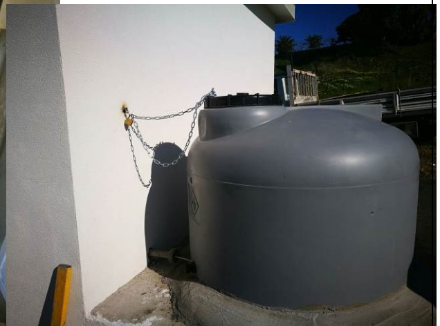
Nuovo serbatoio per lo stoccaggio dell'ipoclorito