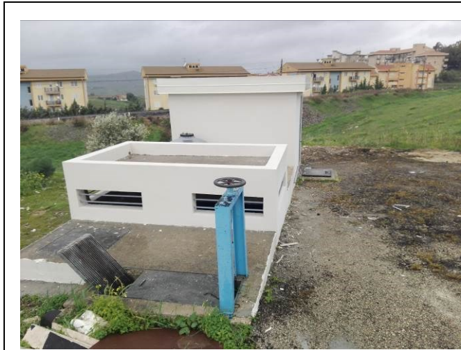
Paratia, griglia e vasca di ossidazione/sedimentazione